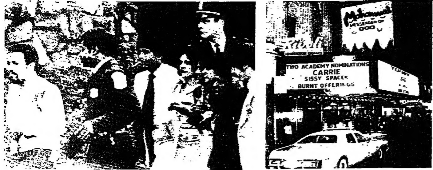
رؤساء وزراء بريطانيا لدى وصوله الى واشنطن... منظمة «بناي بيرت»

ابو ميزر - تتمة تتمة «... ويعتبر الاسرائيليون الميثاق الوطني الفلسطيني دليلا على ان منظمة التحرير الفلسطينية تعمل للقضاء على الدولة اليهودية...»